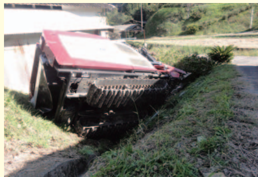
▲細い道からはずれ、横転した様子

コンバインで作業後、格納庫までの帰り道で、路肩でバランスを崩し、横転。修理不能となり、買い替えた。